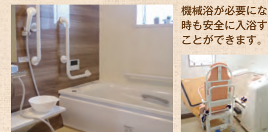
機械浴が必要になった 時も安全に入浴する ことができます。