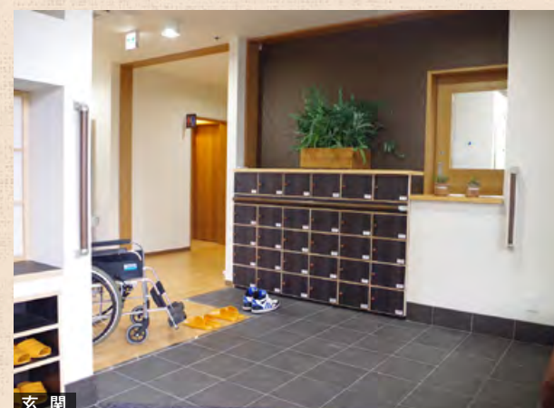
明るく広々とした玄関でみなさまをお迎えいたします。

談話室では家族やお友だちと会話を楽しんだりします。 お天気の良い日はとなりのスーパーやバルコニーで、 外の空気を吸ってリフレッシュしましょう♪