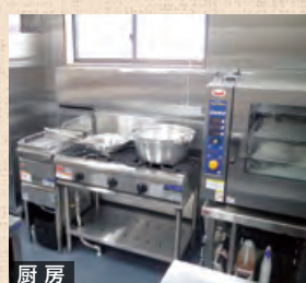
最新の設備でおいしい ごはんを作ります!

毎日のお楽しみといえば食事の時間です。 1階にある広くて明るい食堂で、心を込めた 手作りの食事を召し上がっていただきます。 静岡産の食材をふんだんに使った自慢の料 理を味わってくださいね♪