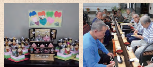
季節のたのしいイベントがたくさんあります。